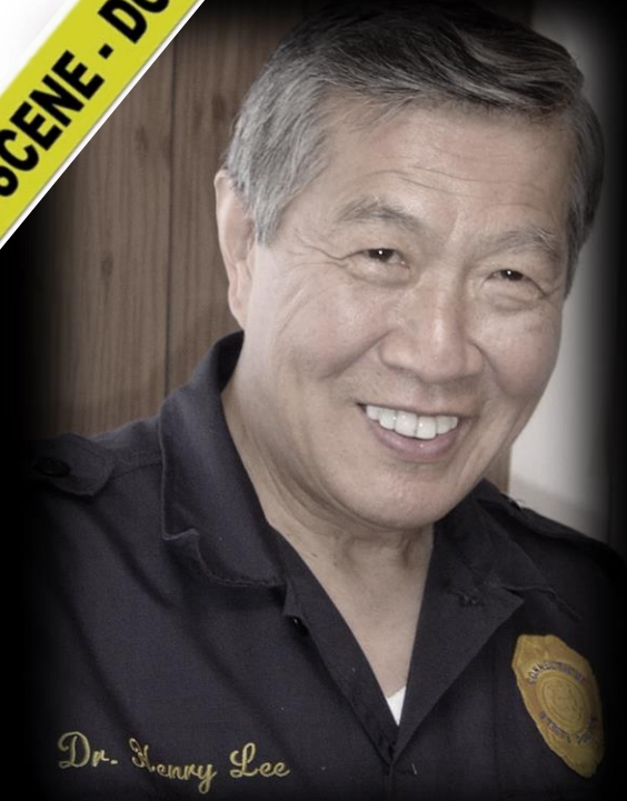
Dr. Henry Lee World-renowned Forensic Scientist