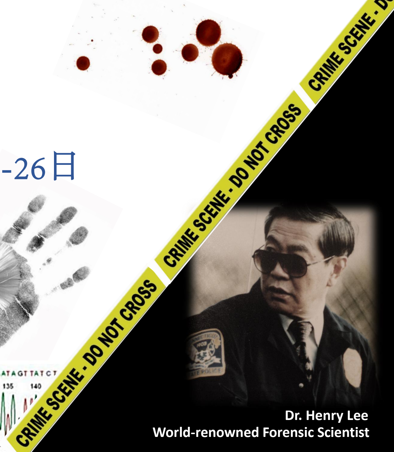
Dr. Henry Lee World-renowned Forensic Scientist