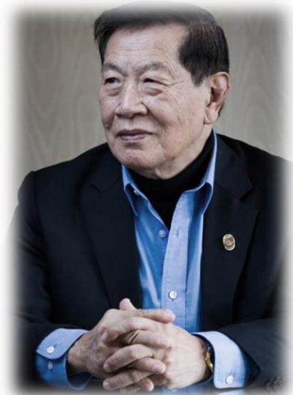
李昌钰博士 Dr. Henry Lee Chair Professor Forensic Science Dept Founder & Director Henry C. Lee Institute